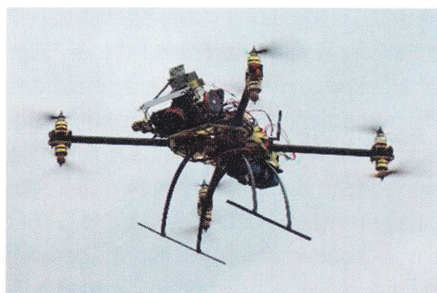
Abb. 1: Oktokopter mit Ausrüstung (Durchmesser: 80 cm).

Das individuelle Design eines senkrecht startenden MAV ermöglicht eine Befestigung aller erforderlichen Geräte, um moderne Photogrammetrie durchzuführen. Die Plattform wurde mit acht bürstenlosen Motoren ausgerüstet, um die Nutzlast und die Redundanz im Falle eines Motorschadens zu erhöhen. Auf dem MAV sind verschiedenste Sensoren untergebracht. Unter anderem befindet sich auf der Plattform der von der gleichnamigen Gemeinschaft entwickelte Autopilot Ardupilot APM 2.6 , welcher für die Stabilisierung zuständig ist und den autonomen Flug sicherstellt. Er besteht aus MEMS Gyroskopen und Beschleunigungssensoren, einem dreiachsigen Magnetsensor, einem barometrischen Drucksensor und einem kostengünstigen Einfrequenz-GPS-Empfänger. Das Zusammenwirken all dieser Navigationskomponenten erlaubt eine