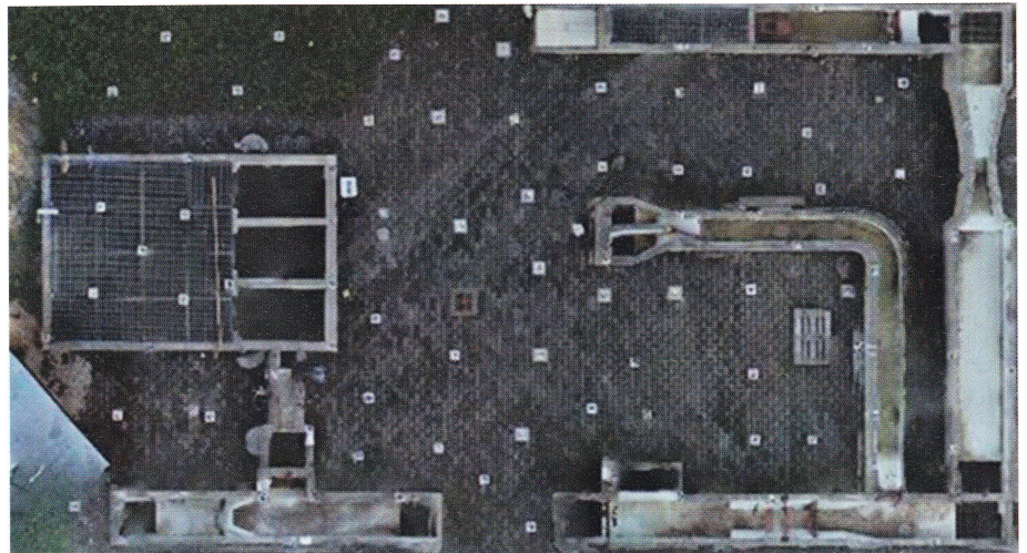
Abb. 3: Kalibrierungsfeld an der EPFL.

Es wurden zwei Flüge durchgeführt: an verschiedenen Tagen und mit unterschiedlichen Umgebungsbedingungen. Der erste Flug diente in erster Linie der Kalibrierung der Kamera. Dabei wurden insgesamt 92 Bilder aufgenommen, und zwar aus zwei unterschiedlichen Flughöhen (5 m und 8 m) und mit verschiedenen Konvergenzwinkeln der Kamera. Der Zweck der Kamerakalibrierung ist die Ermittlung der IO-Parameter. Diese Para-