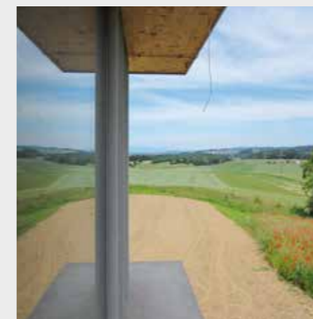
Villarepos (FR)

Cours Le cadre légal des constructions hors zone à bâtir, Fribourg, 20 janvier 2022. Informations, programme et inscriptions sur: espacesuisse.ch > Formation