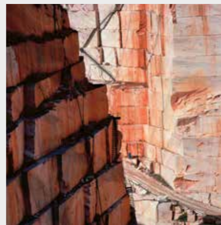
Untitled, Open Space Office series, Portugal, 2011 © Tito Mouraz

Terra, Triennale d'architecture de Lisbonne 2022, du 29 septembre au 5 décembre 2022. Informations: trienaldelisboa.com