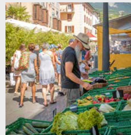
Marché de la vieille-ville de Sion

Séminaire et Assemblée générale. L'approvisionnement alimentaire et l'alimentation jouent un rôle prépondérant dans nos vies quotidiennes et impactent fortement nos territoires de multiples façons tout en restant souvent peu abordés. Ce séminaire entend apporter un éclairage multi-orienté et dresser les perspectives dans une vision durable. En partenariat avec la Ville de Sion.