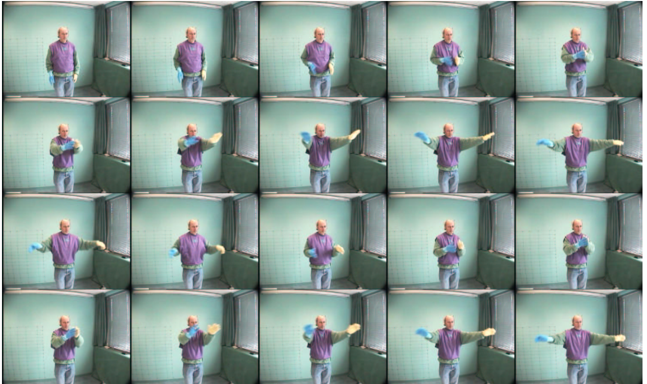
FIG. 4 – Une occurrence du geste “nager”. Le geste, répété ici deux fois, entre les deux attitudes de repos (première et dernière images), dure 50 images. Une image sur deux est représentée (toujours la vue de droite).