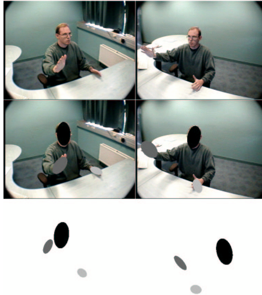
FIG. 2 – Haut : Images d'origine droite et gauche d'une personne sans gant coloré sur les mains. Milieu : Images d'origine avec projection des ellipsoïdes. Bas Gauche : Projection des ellipsoïdes dans le plan xy d'une caméra virtuelle située entre les deux caméras. Bas Droit : Projection des ellipsoïdes dans le plan yz d'une caméra virtuelle située entre les deux caméras.

de vêtements colorés n'est pas une contrainte rédhibitoire. En revanche, en utilisation réelle, une telle contrainte nuit à l'ergonomie de l'IHM gestuelle et il est souhaitable que la trajectoire des mains nues soit obtenue comme cela a été fait en [9]. La figure 2 montre le résultat d'un tel suivi d'une personne sans gants colorés sur les mains : les ellipsoïdes sont correctement positionnés sur la tête et sur les mains et les trajectoires des mains peuvent ainsi être connues au cours d'un geste. Lors de l'apprentissage des gestes, le modèle statistique qui permet le suivi est constitué de quatre ellipsoïdes : un pour la tête et un pour le torse et un pour chacune des deux mains. Chacun des ellipsoïdes est projeté sous la forme d'une ellipse dans le plan de chacune des deux caméras. Une densité de probabilité gaussienne, de même centre et de mêmes dimensions que l'ellipse considérée, est associée à chacune des ellipses. Les paramètres du modèle (positions, tailles et orientations des ellipsoïdes) sont adaptés aux observations des pixels de couleur filtrés lors de l'étape de prétraitement. L'adaptation prend en compte simultanément les pixels détectés issus des deux caméras et est basée sur la recherche du maximum de vraisemblance obtenu par l'algorithme EM.