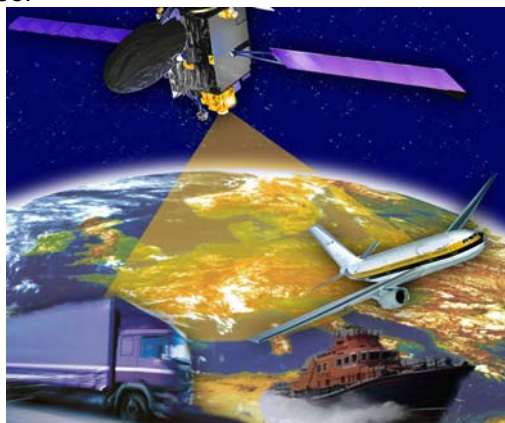
Illustration 1: Satellite EGNOS (European Geostionnary Navigation Overlay Service), une première étape de la navigation européenne pour les transports

Un autre moyen de contrôle consiste à effectuer la mesure à l'aide d'instruments embarqués à bord du véhicule. Ainsi on limite la création d'infrastructures de péage et on remplace les points de mesure physiques par des points de mesure virtuels. Parmi les instruments de mesure, on trouve les méthodes de localisation par satellites, comme le GPS américain, le système russe GLONASS et le futur système européen Galileo.