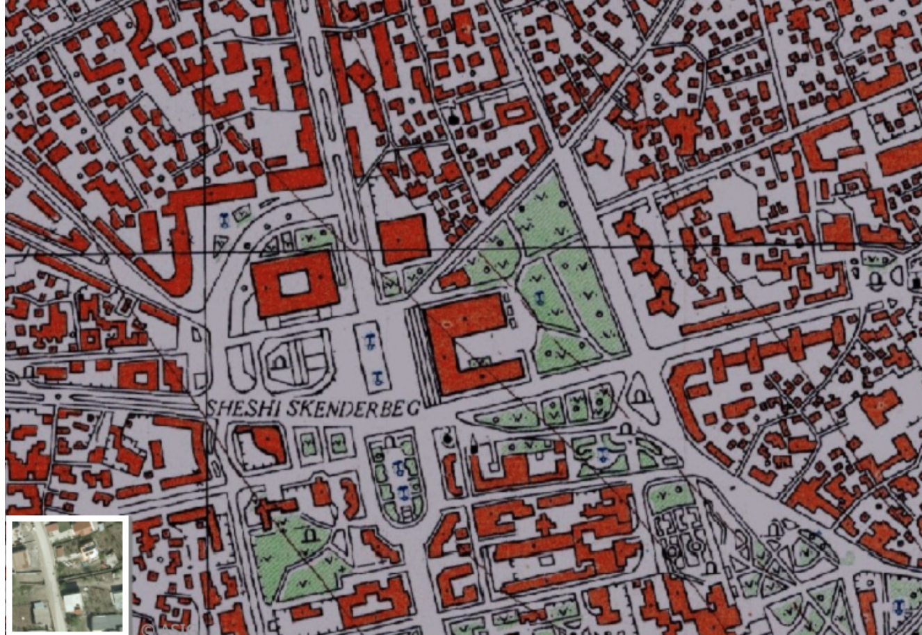
Fig. 2 Harta Topografike e Tiranës, situata e viteve 1980

Në vitin 2013, Rilindja Urbane e promovuar me bujë nga Edi Rama, ende pa u vendosur zyrtarisht kryeministër, ishte hapi i parë për të thyer ideologjinë e tranzicionit dhe për ta maskuar institucionin e pronës private me një veshje të re, që shihte këtë herë si protagonist kryesor arkitekturën dhe strategjitë urbane të ndërmarra nga Partia Socialiste. Ky ishte dhe ndryshimi kryesor nga qeveria e "djathtë" dhe nga politikat e mëparshme të Partisë Demokratike: ndërkohë që berishizmi e bazoi zhvillimin e territorit në mënyrë të rreptë mbi pronën private, duke u dhënë tokë të gjithëve (duke inkurajuar, me mbështetjen e shtetit, zbritjen nga zonat malore të shumë ish-fshatarëve për të zënë ish-parcelat e reformës agrare në zonat e ulëta), Rama e sofistikoji strategjinë, duke ia lënë në dorë zhvillimin cilësisë së arkitekturës dhe duke