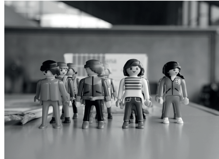
Contributive workshop on emergency housing in the Pavillon Sicli, 2016.

Contributive workshops, organized around series of triggering meta-themes like horizons , rhythm or ground 21 , are critical moments in the activation of contributors. As stakeholders or actors having a stake, that is, an interest, concern or know-how on an issue, contributors are not a given. On the contrary, workshops are vehicles to help inhabitants, officials as well as researchers become contributors. To this end, the workshop must act as an infrastructure of mutual care and attentive listening listening, for which space matters. Beyond words, space has the potential to become a lingua franca able to translate, share and create common grounds for contributive processes to build upon. ALICE workshops often take place within the investigated territories, turning them into a working and productive interface. Along with visits, walk-along interviews, encounters, on-site chantiers and collective prototyping, workshops help contributors connect with the embodied condition of their environmental knowledge, making dormant know-hows emerge. Because the territory supports and co-creates those know-hows, it can work as an interface for their communing. Likewise, while in a workshop, the use