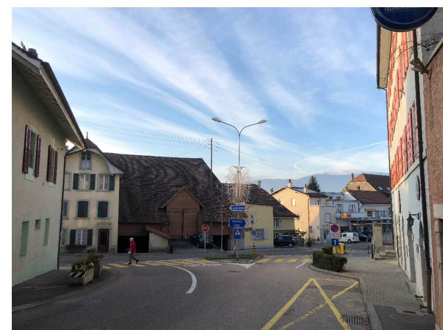
Place communale existante