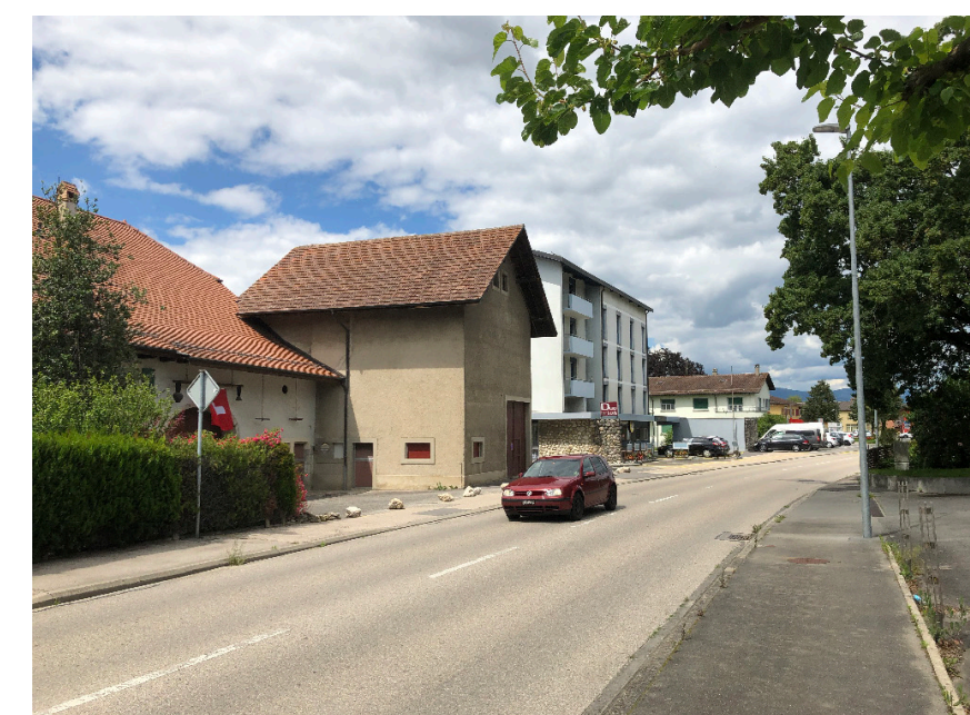
Portion de la Grande Rue existante