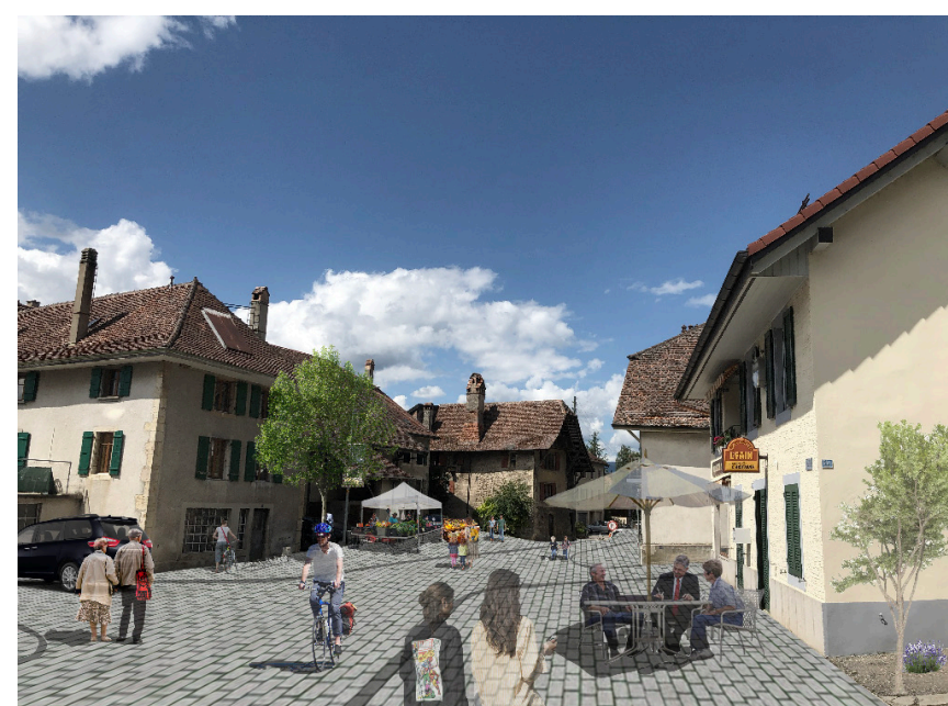
Centre historique projeté