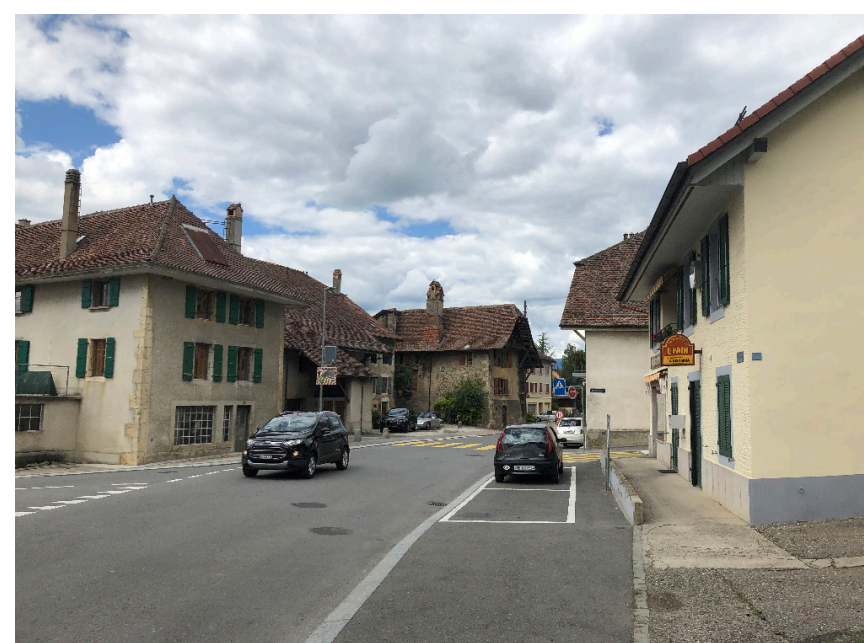
Centre historique existant