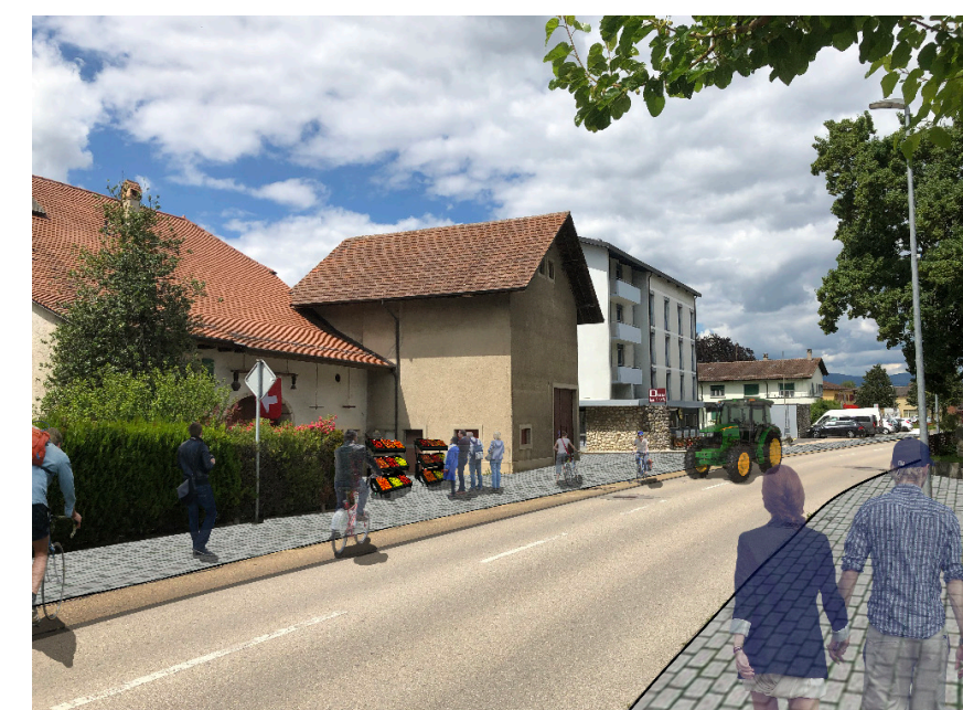
Portion de la Grande Rue projetée