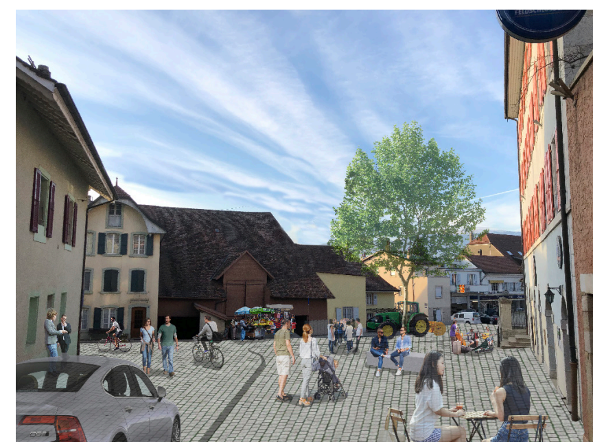
Place communale projetée