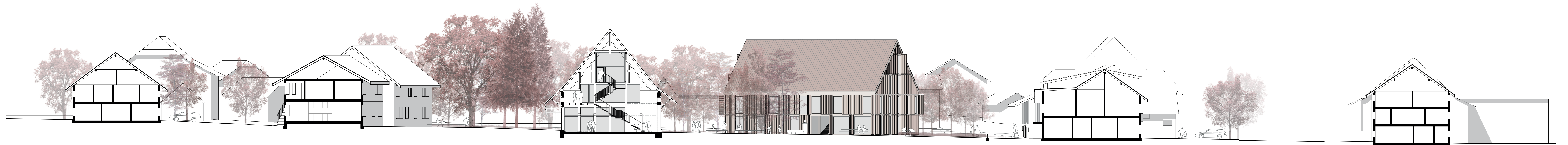
Coupe longitudinale 1.200