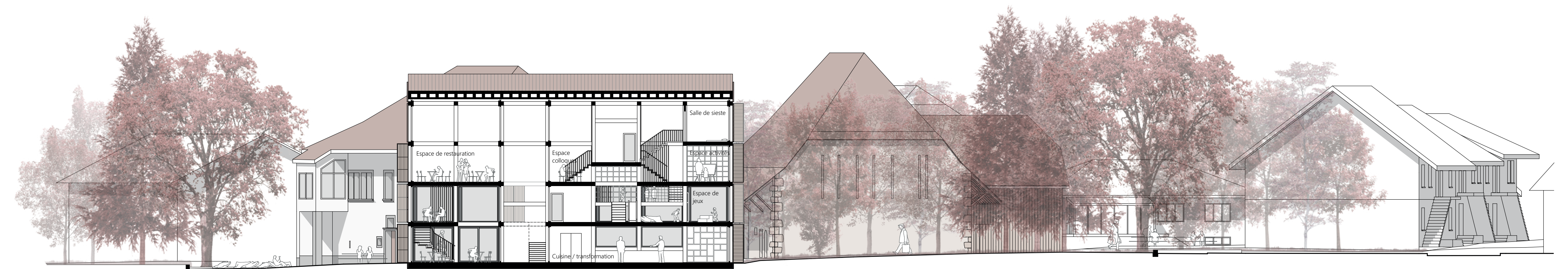
Coupe longitudinale nouveau bâtiment 1.200