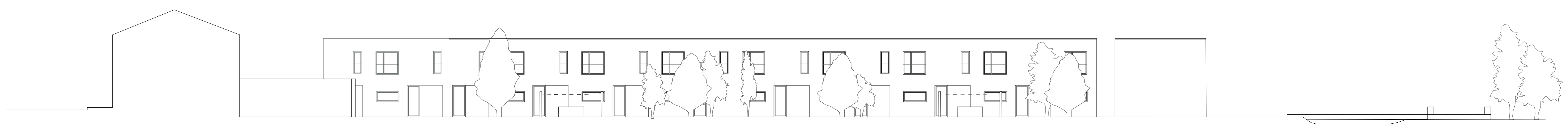
Façades Nord échelle 1:200