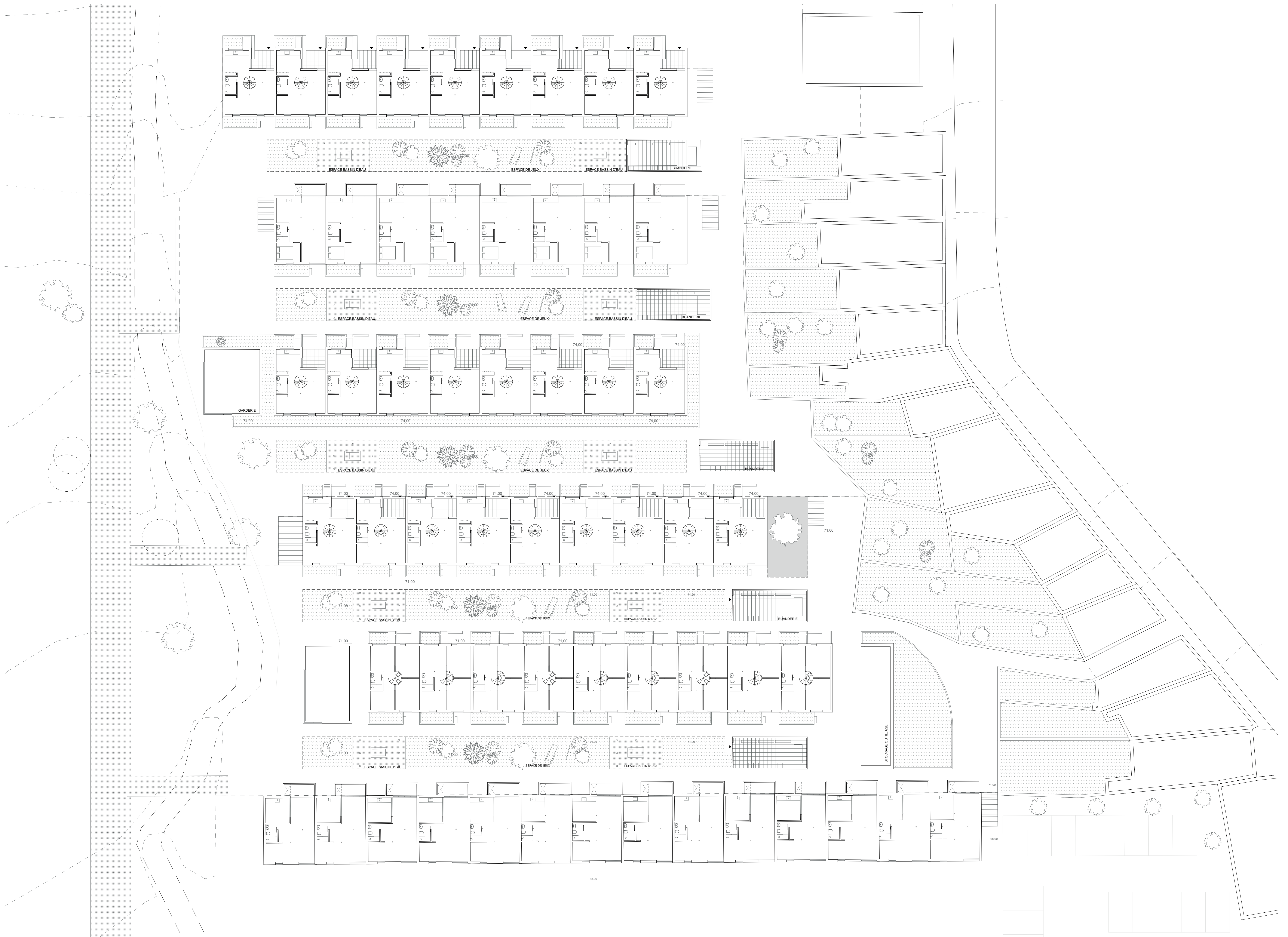
Espaces extérieurs et typologies échelle 1:200