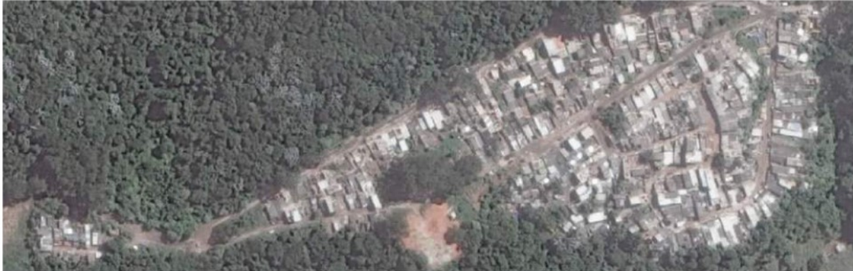
Fig nº4: Vilanova Esperança: mapa de densidad residencial.