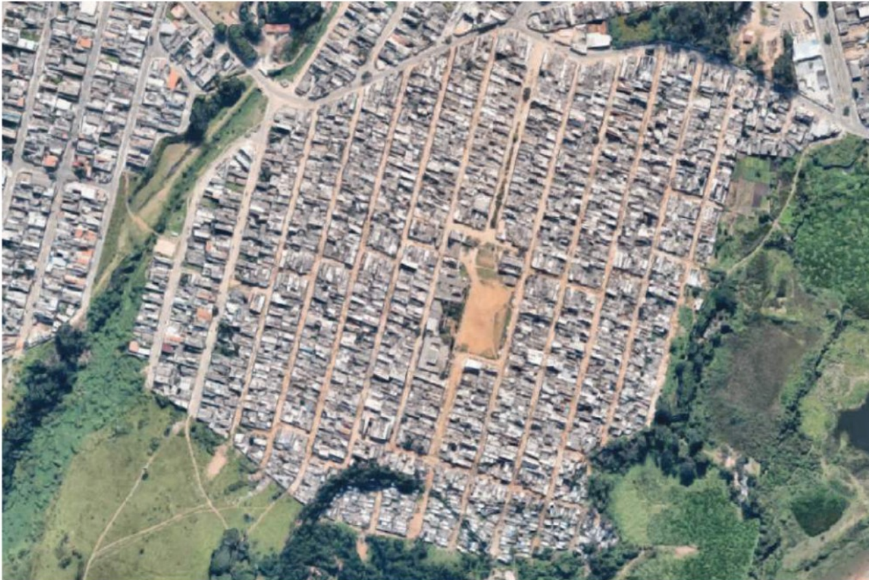
Fig. 3: Imagen satelital de la comunidad Anita Garibaldi, Guarulhos (área metropolitana de São Paulo), 2016.

Source: Google Maps | Elaboration: Pessoa Colombo, V; Pacifici, M.