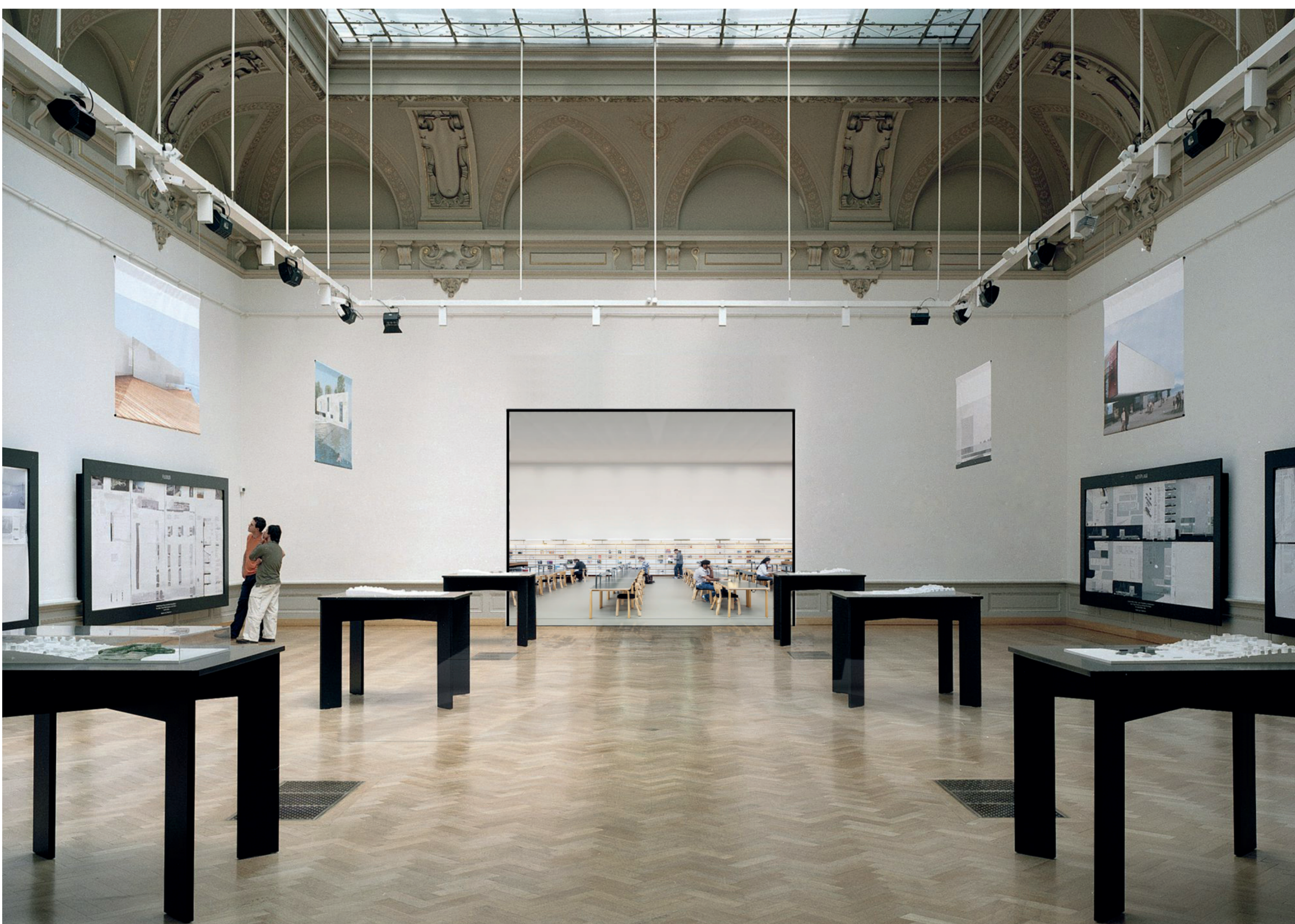
2 Musée 304 vers Salle de lecture 301 Collage d'idées / 400 x 282