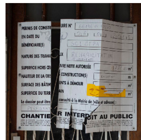
Panneau de chantier (réhabilitation) daté de 2015 photo prise avril 2018

«Ils ont dit “oui justement, il y a un projet... on rénove les maisons ! Alors, ça m'étonnerais, elles sont toutes en bon état ces maisons. Ils vont raser, peut-être pour remonter autre chose. Je pense que c'est plutôt ça »