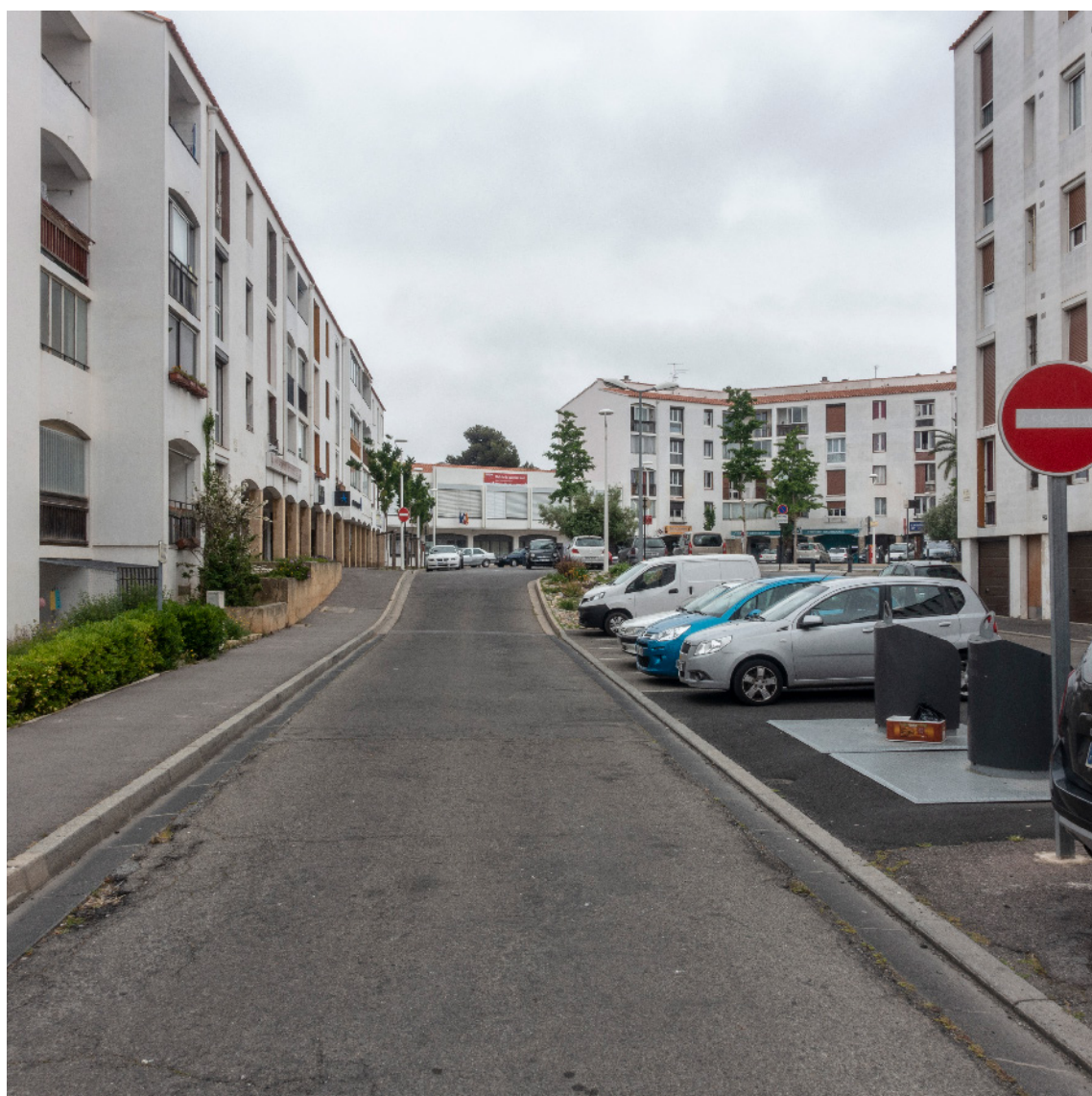
Ville nouvelle du Moulin-à-vent