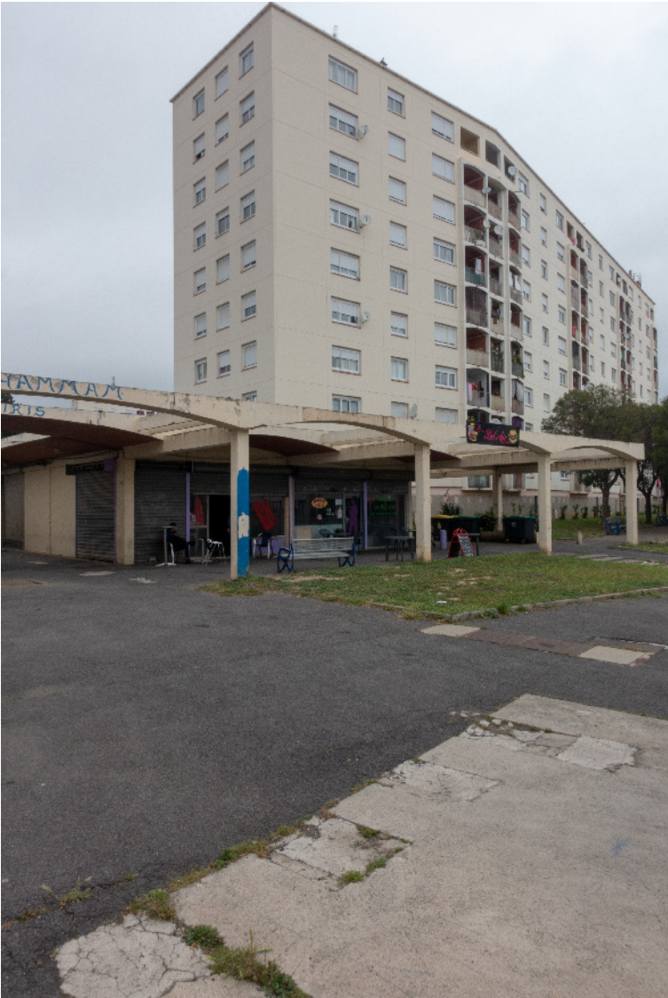
Cité du champs-de-mars