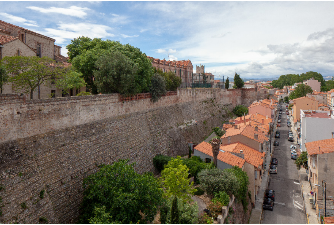
25. Jardins de la Miranda. Vue sur les remparts St-Jacques.