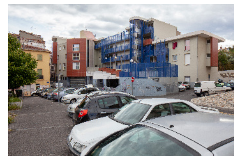
Cité HLM Bétriu et son commissariat, Saint Jacques, promis à la démolition

« Il y en a qu'ils ont mis à Saint-Matthieu, y'en a qui sont du côté de l'avenue Leclerc, y'en a qu'ils les ont mis au champs-de-Mars, des personnes qui habitaient là. Nous on dit : faites des constructions pour loger les personnes qui habitaient là ! »