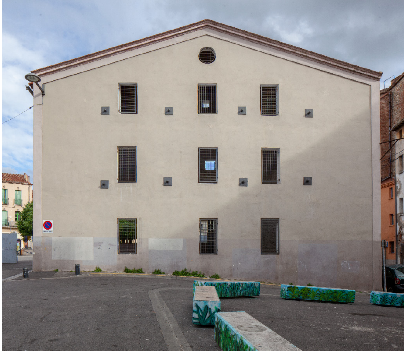
21. Rue des Carmes.