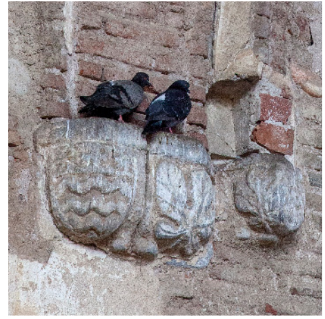
Pigeons, Eglise des Grands Carmes

«J'ai rien compris non plus, ils ont fait une maison pour les pigeons »