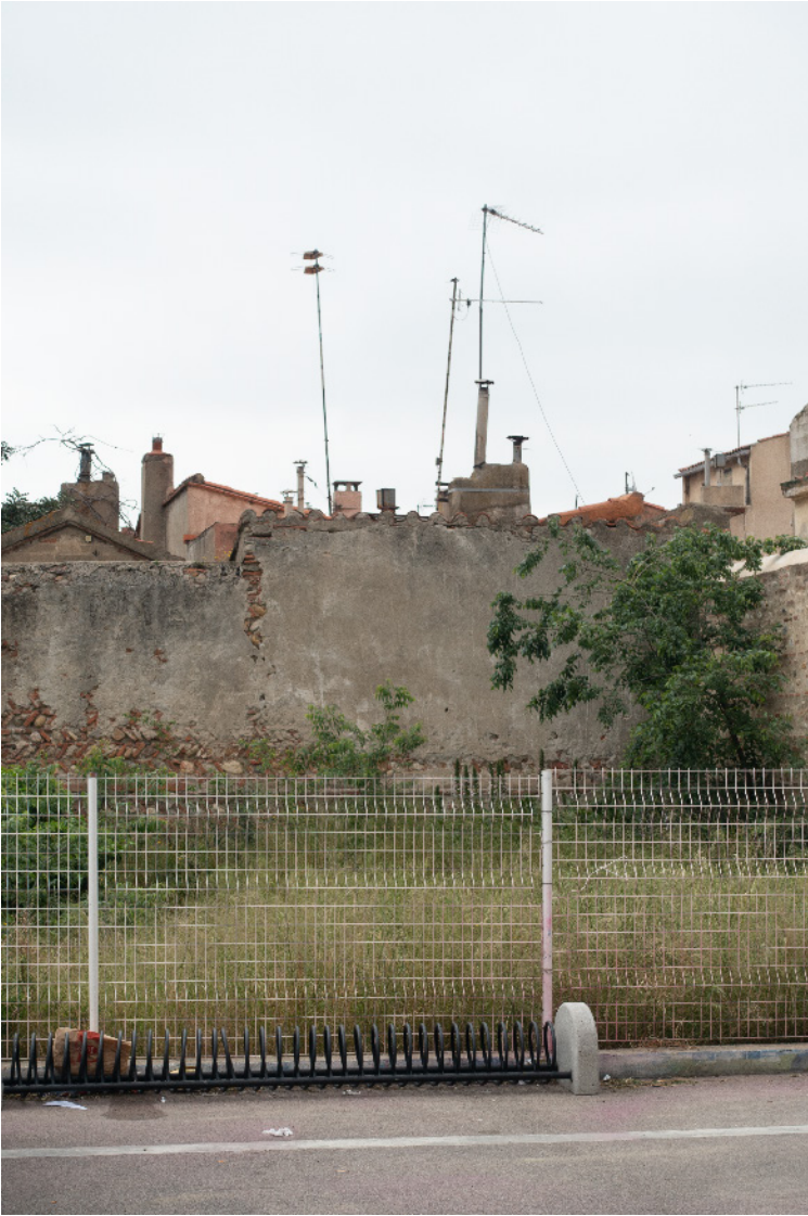
25. L'arsenal, la fontaine des carmes.