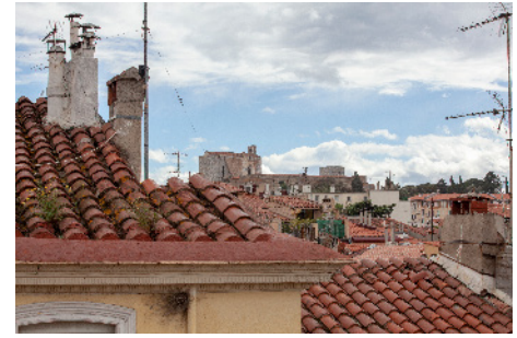
Panorama, La Real.

« C'est une maison où y'a beaucoup de familles qui sont logées, qui appartient aux HLM. Les architectes des HLM ils ont regardé la maison, ils les ont empêchés d'aller plus loin. Ils ont dit "Non vous touchez pas. La maison elle a pas bougé, tout est conforme, en bon état. Vous y touchez pas." Et ils se sont arrêtés là. Mais ils voulaient continuer jusqu'en bas. Jusqu'en bas eux !»