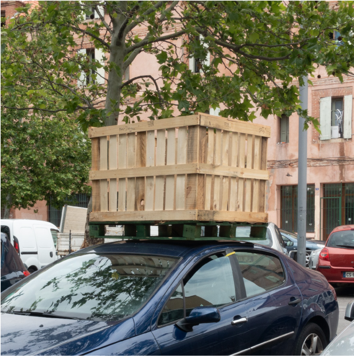
Place del Puig.