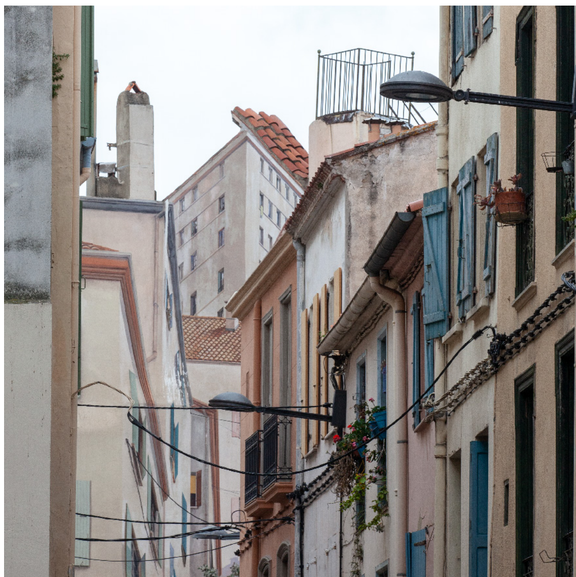
La Real, Avril 2018 Trompe-l'oeil