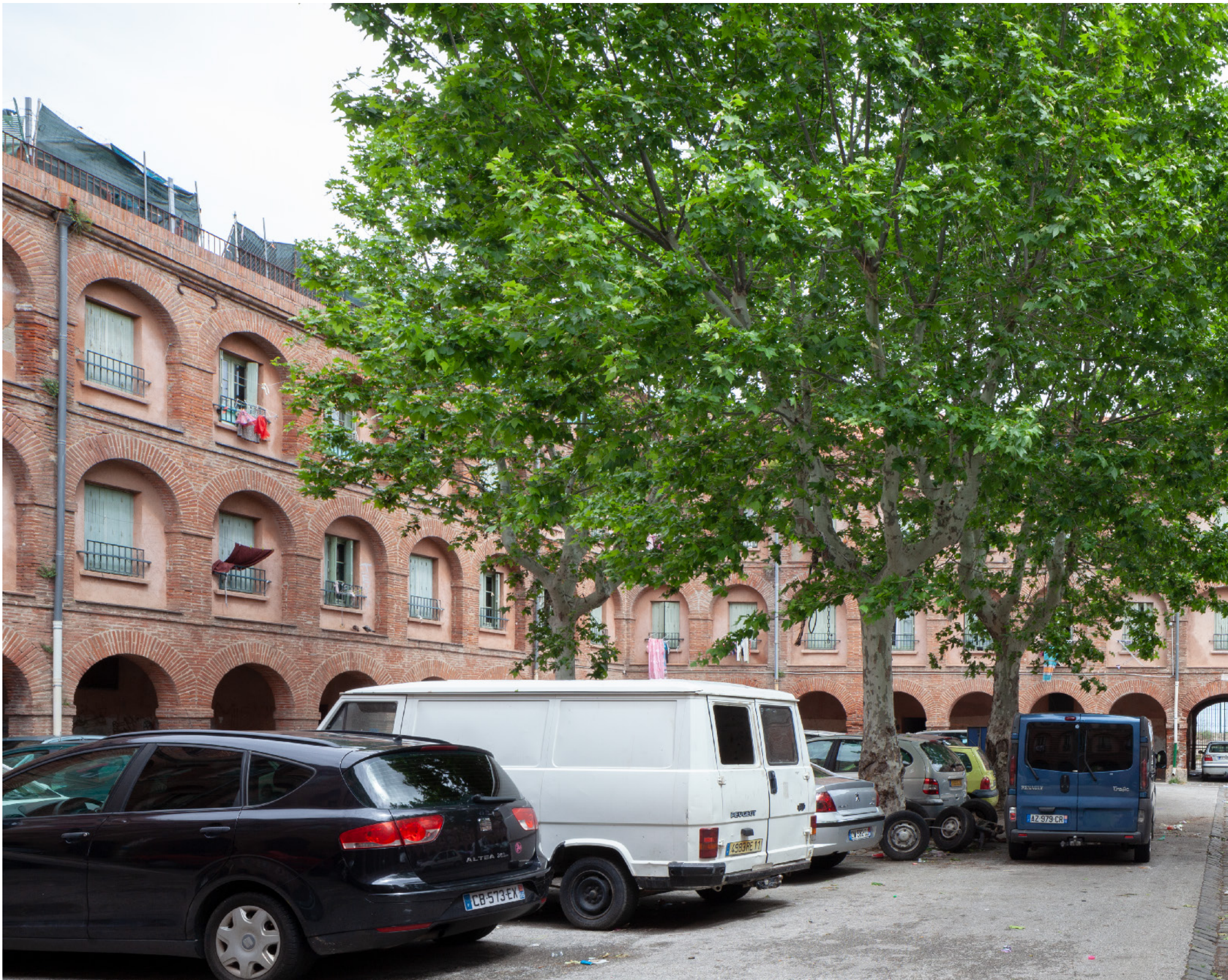
26. Caserne Saint-Jacques.