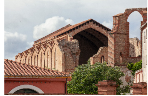
L'Eglise des Grands Carmes Vue depuis la rue des remparts Saint-Jacques

«Ceux qui parlent de Ghetto pour Saint-Jacques n'y sont jamais allés»