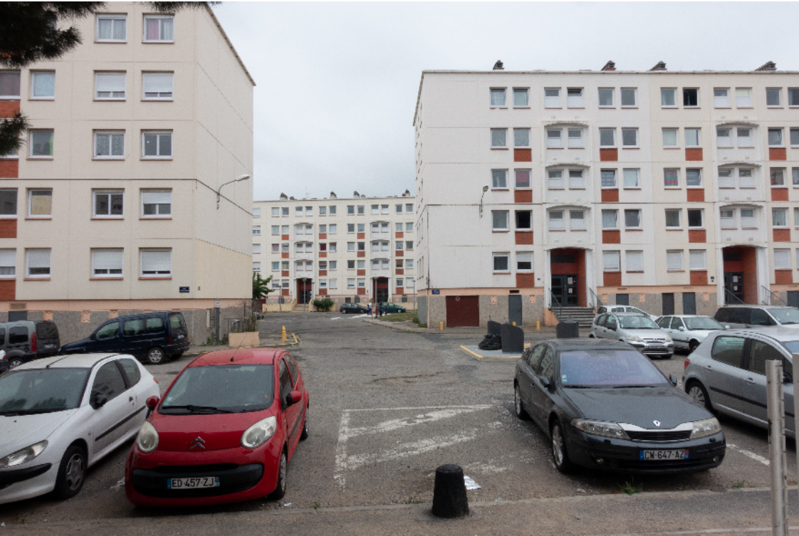
Cité du champs-de-Mars