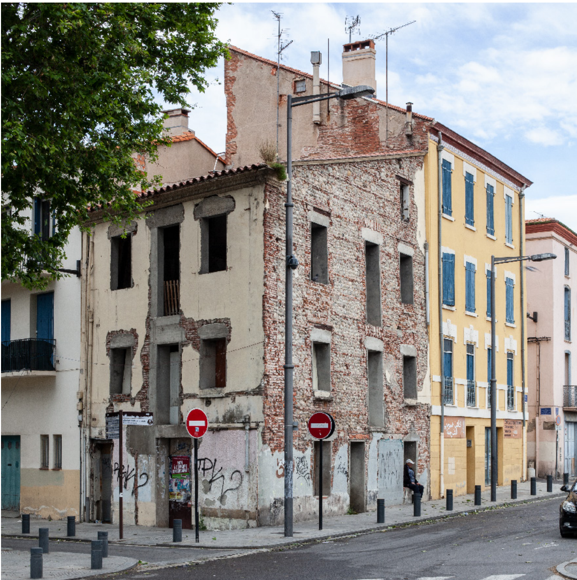
24. Place Jean Moulin. Ancienne discothèque.