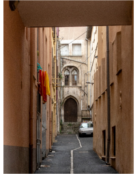
Couvent des Augustins, La Real.

«J'aimerais bien que la mairie ils fassent des rénovations de façades »