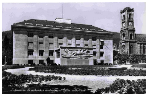
Fig. 2: Vue du bâtiment abritant le Laboratoire Suisse de Recherche Horlogère (LSRH) inauguré en 1940.

La situation est diamétralement opposée au Japon. Les fabricants de montres de ce pays, en particulier Hattori & Co., qui vend ses montres sous la marque Seiko, s'engagent après la Première Guerre mondiale dans un processus de développement technologique dont l'objectif est de rattraper les concurrents suisses au niveau de la précision. 12