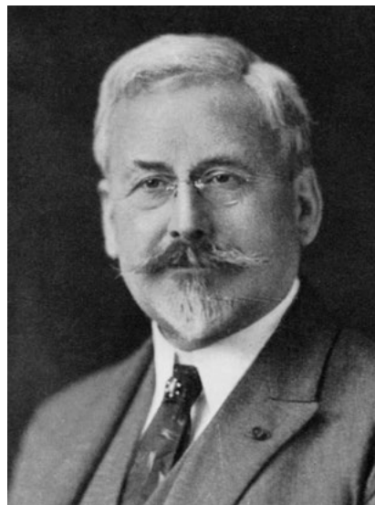
Fig. 1: Charles-Edouard Guillaume (1861-1938).

FAR, la société Nivarox SA. 11 Ainsi, l'industrie horlogère suisse ne coopère pas avec des universités mais avec des scientifiques et des ingénieurs indépendants pour acquérir de nouveaux savoirs liés aux matériaux.