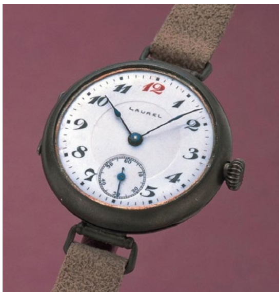
Fig. 7 : Seiko Laurel de 1913, première montre bracelet japonaise.

de la production et de l'assemblage. 36 En 1961, il rédige un long rapport sur ces questions dans le journal d'entreprise de Daini Seikosha, dans lequel il démontre que l'industrie horlogère japonaise n'est pas en retard sur ses concurrents étrangers dans ce domaine. 37 Il reste cependant difficile d'évaluer la contribution de ces consultants, les développements internes et les coopérations avec d'autres entreprises privées (constructeurs de machines-outils notamment) étant beaucoup plus fondamentales.