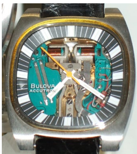
Fig. 5 : Première montre électronique à diapason acoustique.

Quant à l'innovation de procédés dans la montre mécanique, elle présente un profil similaire en matière de coopération avec des universités. En Suisse, jusqu'à la fin des années 1950, les entreprises qui mettent en place des méthodes de production en masse le font sans recourir à des universités. Lorsqu'elles coopèrent avec des partenaires externes, il s'agit généralement d'autres entreprises privées, principalement des fabricants de machines-outils. Au Japon, la coopération observée pour le développement de produits existe également pour les méthodes de production. La copie de machines-outils suisses est réalisée au cours des années 1950 grâce à une coopération entre Hattori, le fabricant de machines Tsugami et le professeur Tamotsu Aoki, de l'Université de Tokyo – lui-même membre du CRTH. 20