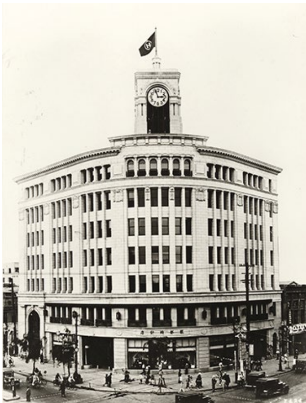
Fig. 3: Entreprise K. Hattori & Co., 1932.

L'un des principaux enjeux est également le développement de nouveaux alliages pour les spiraux et les ressorts. Hattori bénéficie de la coopération avec un institut universitaire spécialisé dans la métallurgie, fondé en 1916 pour soutenir le développement de l'industrie d'armements: le Centre de recherches métallurgiques de l'Université de Tohoku ( Kinzoku zairyo kenkyujo ). 13 Soutenu financièrement par le zai-batsu Sumitomo, un conglomérat industriel particulièrement engagé dans la production de métaux, ce centre réalise de nombreuses recherches en faveur des grandes entreprises privées du pays. Hattori lui commande la mise au point d'un nouvel alliage pour des ressorts de montres dans les années 1930, mais la guerre met un terme à cette première coopération. Les recherches sont reprises en 1954 par le professeur Hakaru Masumoto, qui a développé des alliages pour l'industrie aéronautique militaire durant la guerre. 14 Deux ans plus tard, il présente un prototype de ressort en coelinvar, caractérisé par sa légèreté et son faible coefficient de dilatation. L'année suivante, en 1957, Hattori ouvre une nouvelle usine dans la ville de Sendai, spécialisée dans la fabrication en masse de ces ressorts. 15 Il faut souligner