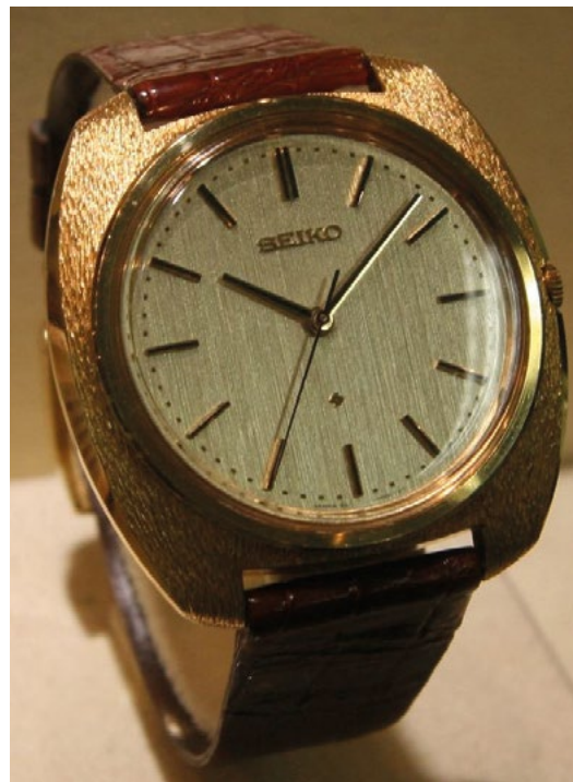
Fig. 8 : Seiko Astron de 1969, première montre à quartz commercialisée.