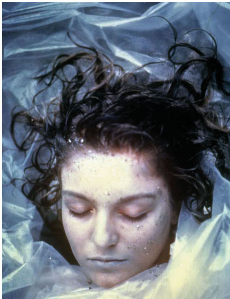
Sheryl Lee als Laura Palmer.

Van een vriend kreeg ik een computerbestand op diskette, dat van op het bureaublad aangeklikt kon worden, waarna het in een zwart venster met witte gepixelde letters een quote uit Twin Peaks aanbood. ‘In the grand design, women were drawn from a different set of blueprints’ – een aforisme van deputy Hawk, om collega Andy te troosten wanneer diens vriendin vreemd doet. ‘She’s filled with secrets’ – een uitspraak van de dwerg in The Black Lodge, uiteraard over Laura. En nog eentje: ‘Everyday, once a day, give yourself a present. Don’t plan it, don’t wait for it, just let it happen’ – advies van Cooper en een vrijgeleide om nog een koffie met kersentaart te bestellen. Het zijn zinnnetjes die aangeven uit welk universum Twin Peaks stamt: het Amerika van de golden fifties , niet toevallig de wereld