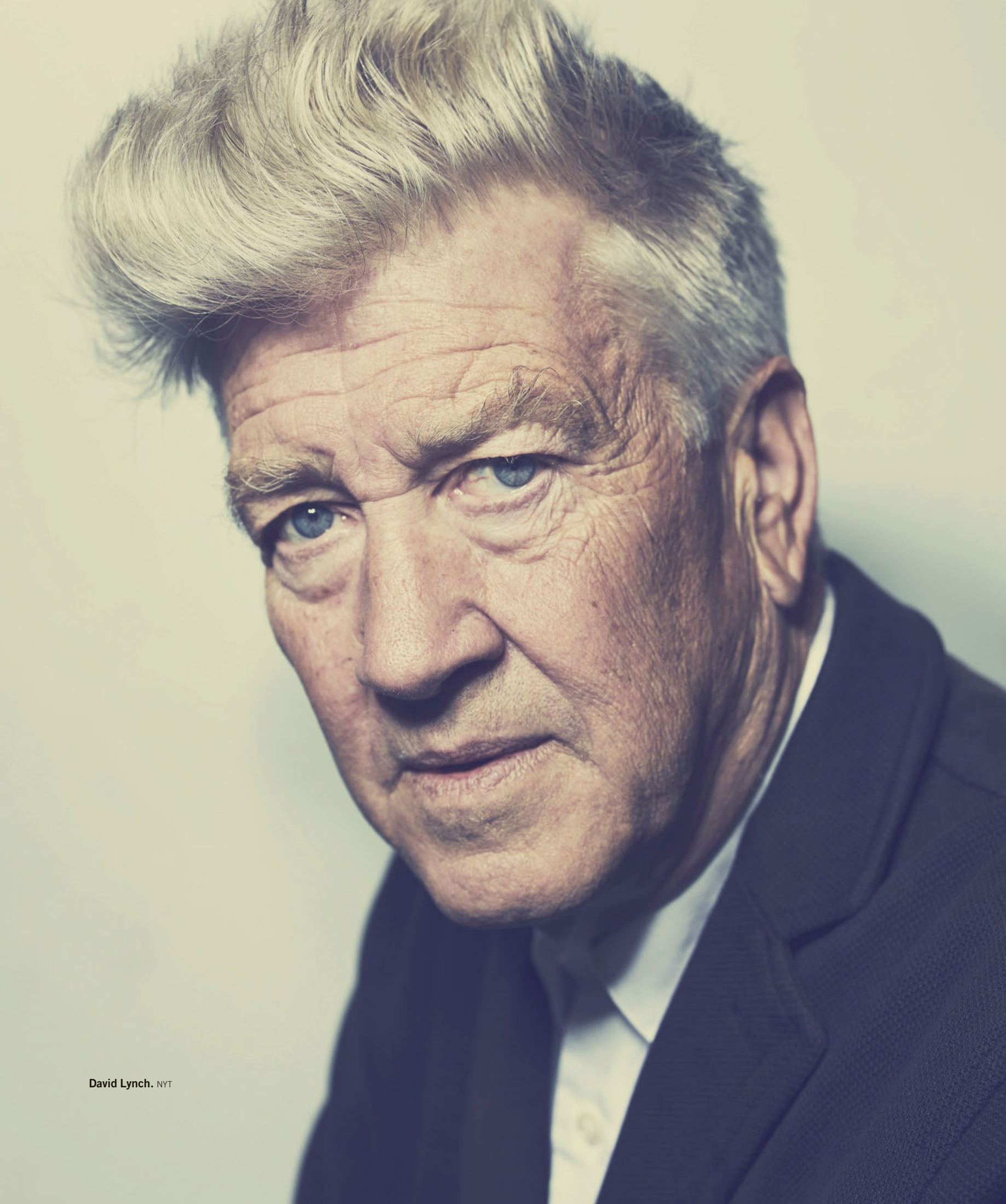
David Lynch.