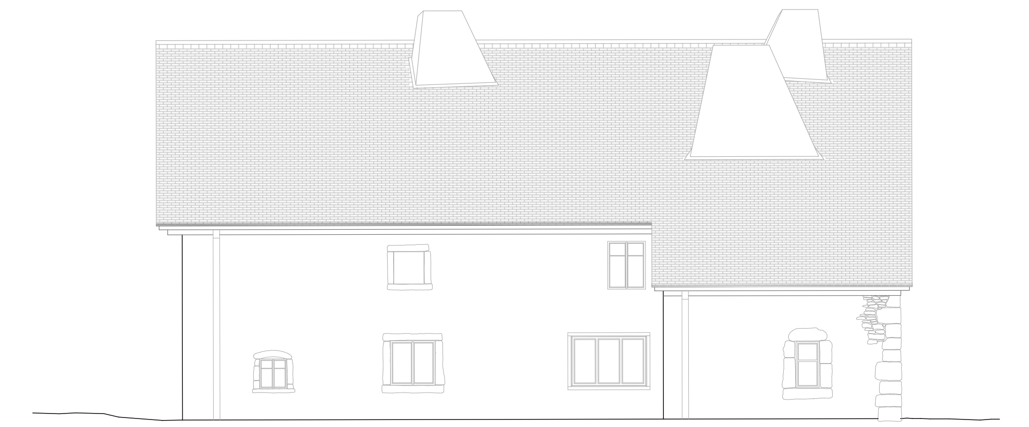
Façade ouest | 1:100