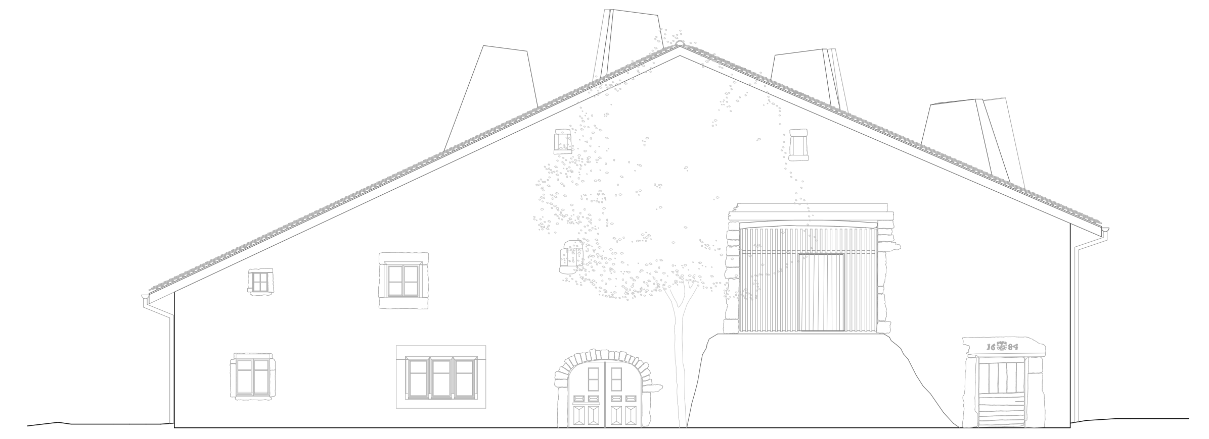
Façade sud | 1:100