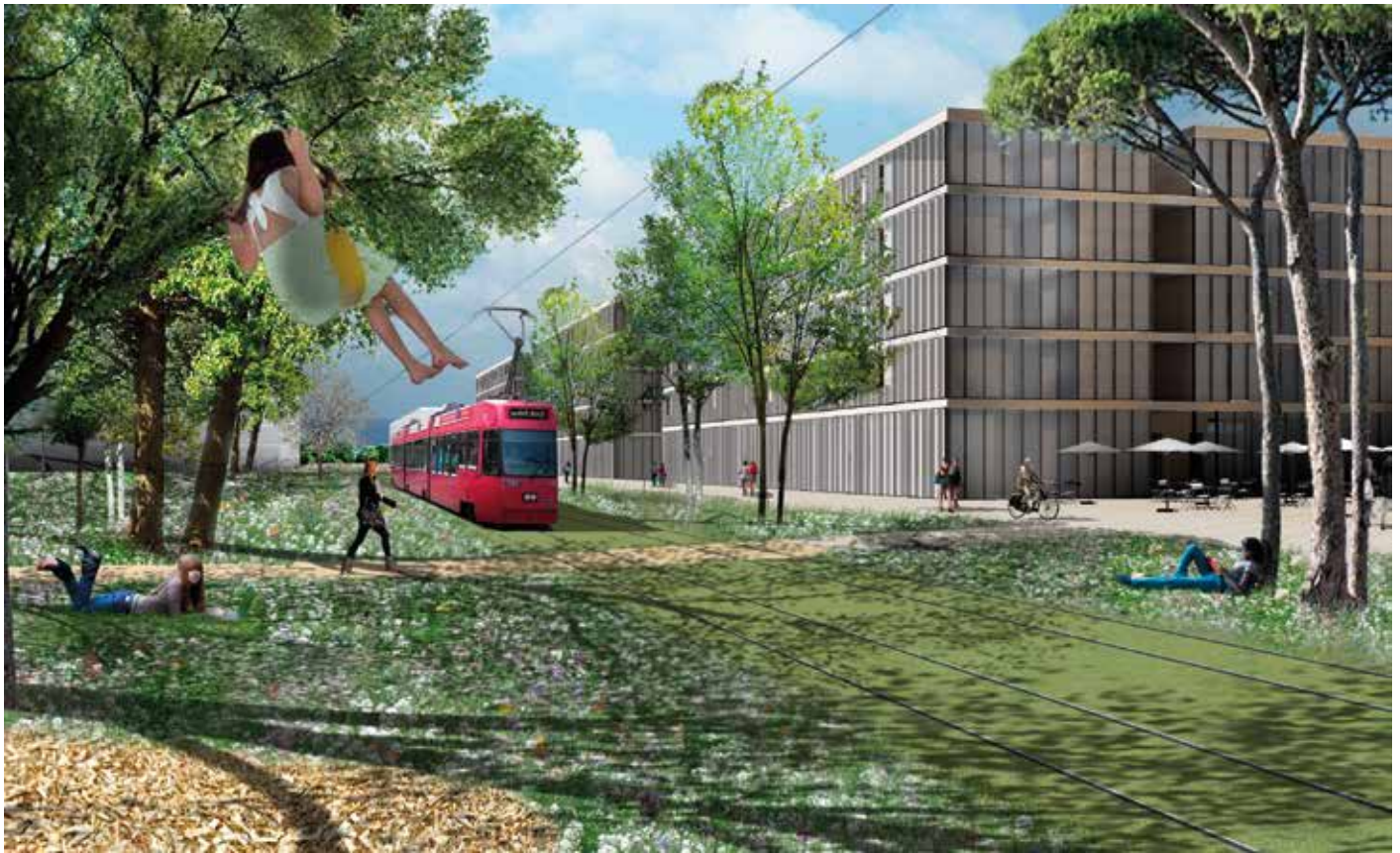
4 Visualisation d'une nouvelle polarité urbaine développée dans le cadre du projet interdisciplinaire Green Density

La transformation des territoires métropolitains entre de surcroît en résonance avec une autre mutation sociétale, celle liée à la transition énergétique. La mise en œuvre d'une société à 2000 Watts, respectivement la décision de principe de sortir progressivement du nucléaire, implique en effet une réduction massive des besoins énergétiques et un recours largement prioritaire aux énergies renouvelables 11 . Dans ce contexte évolutif, les interactions entre les consommateurs et les producteurs seront de moins en moins centralisées. En termes de projet urbain, cela tendra à accroître les besoins de cohérence entre les stratégies spatiales et énergétiques.