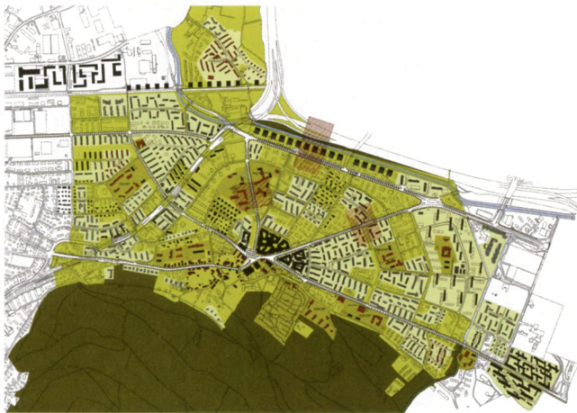
Plan stratégique pour la densification de Schwamendingen