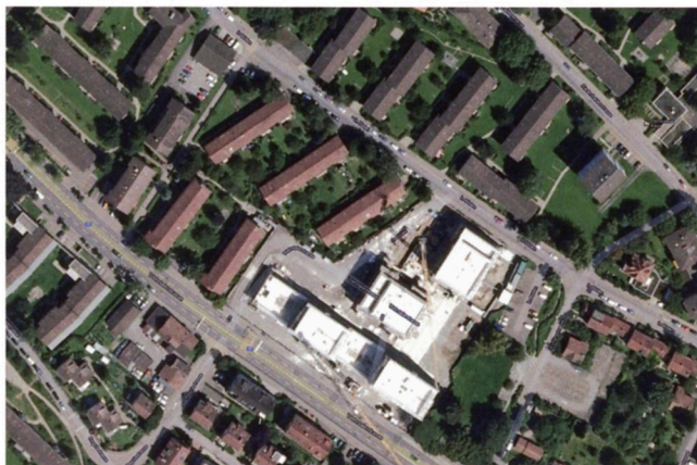
Ensemble Frohheim, vue aérienne: à droite, la première étape en construction; à gauche, les bâtiments préexistants