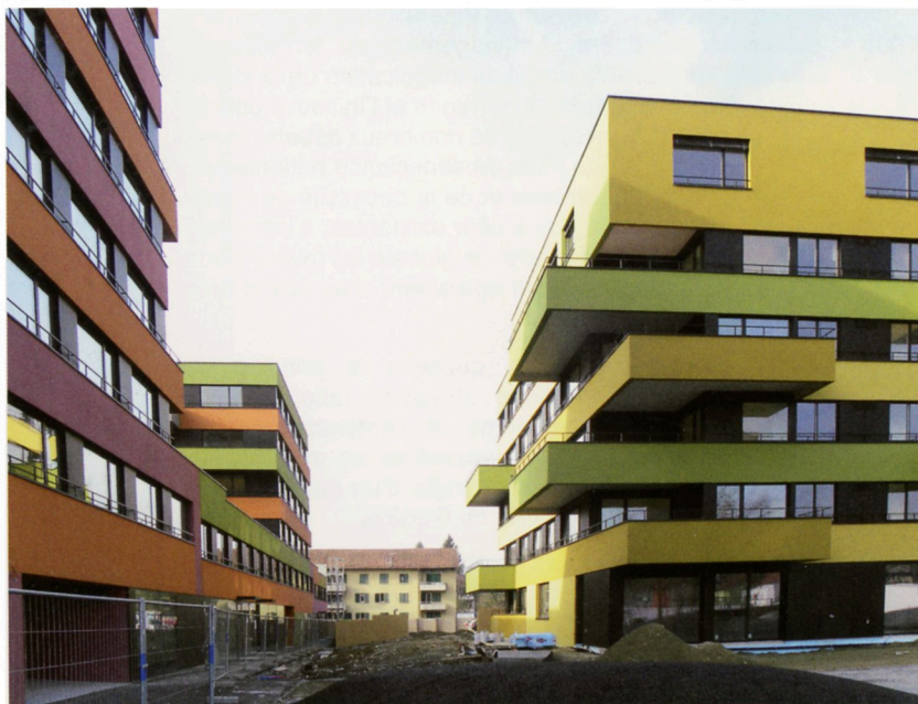
Ensemble Frohheim, vu depuis l'intérieur de la parcelle, à l'achèvement de la première étape. Au deuxième plan, les bâtiments préexistants qui laissent aujourd'hui place à la deuxième étape

les spécificités de chaque agglomération, afin d'élaborer des politiques de densification qui proposent non seulement des surfaces bâties supplémentaires mais aussi des plus-values qualitatives. De nouvelles polarités à créer, des sites à revitaliser, des ressources foncières à valoriser, des ensembles bâtis à compléter, des éléments paysagers à requalifier : autant de sollicitations qui, espérons-le, continueront à donner naissance à des projets d'urbanisme prometteurs et à des réalisations architecturales exemplaires.