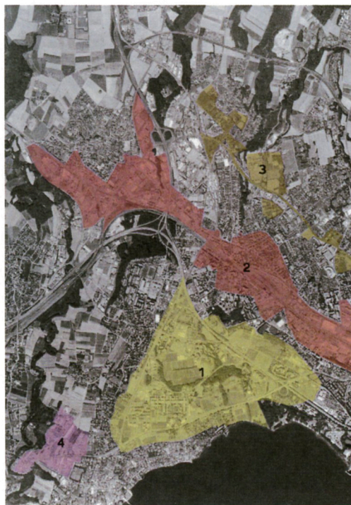
Périmètres des quatre chantiers territoriaux du SDOL

Dans ces secteurs, les stratégies de densification rencontrent un certain nombre de spécificités qui sont souvent absentes des friches ou des centres urbains. Dans le cadre de cet article, seules trois spécificités suburbaines seront évoquées de façon plus détaillée 2 : l'ampleur des périmètres; leur spatialité diffuse; la jeunesse de leur bâti. Elles permettent également d'expliquer l'aspect novateur de quelques stratégies de densification élaborées actuellement, que ce soit à l'échelle de l'agglomération, du quartier ou de la parcelle.