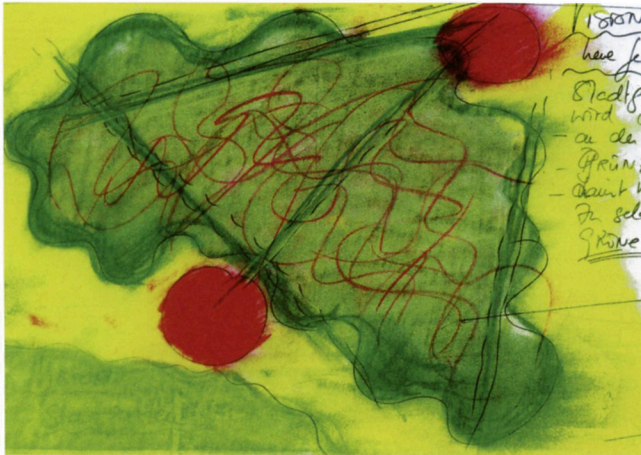
Croquis de Marianne Burkhalter pour la densification de Schwamendingen