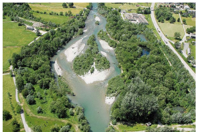
Abb. 3 Aufweitung im Valle Mesolcina bei Grono (GR).