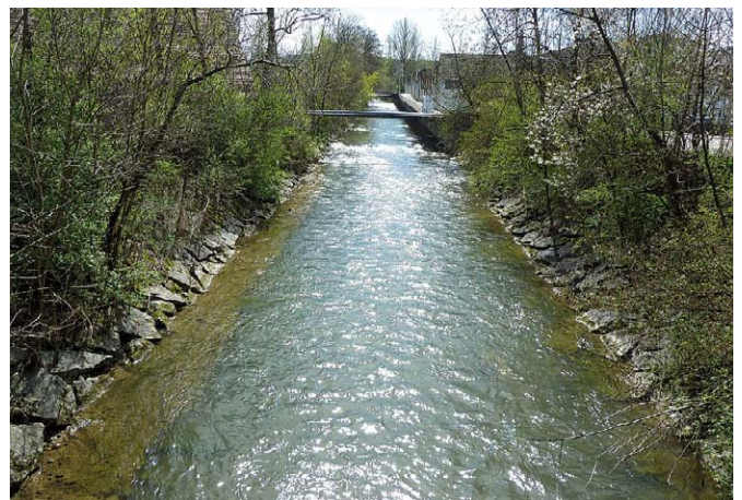
Abb. 1 Verbaute Wigger bei Zofingen (AG).

In eingeebten, kanalisierten Gerinnen erhöht sich der Abfluss schneller, wodurch sich die Hochwasserspitzen im Unterlauf der Gewässer verschärfen. Wenn der Abflussquerschnitt zu klein ist, bahnt sich das heranströmende Wasser seinen eigenen Weg. In dicht besiedelten Gebieten hat dies fatale Folgen für den Menschen und seine Infrastruktur (Abb. 2). Seit 1987 häufen sich in der Schweiz die Hochwasserereignisse. Das Ausmass der Schäden zeigt, dass die kanalisierten Gerinne