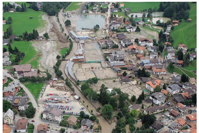
Abb. 2 Hochwasser bei Klosters (GR) im August 2005.