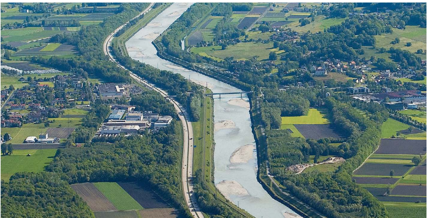
Luftaufnahme des Alpenrheintals (Haag SG, Bendern FL).

In der Schweiz werden etwa 55 % der Stromversorgung mit Energie gedeckt, die in den rund 1600 Wasserkraftzentralen generiert wird (BFE 2010). Speicherkraftwerke verändern den Wasserhaushalt von Fliessgewässern wesentlich, da sie diesen über längere Strecken Wasser entnehmen. Es entstehen Restwasserstrecken, deren Abflüsse oft weit unter dem natürlichen Pegelstand liegen. Restwasserstrecken beeinträchtigen den landschaftlichen Wert und die ökologische Funktionsfähigkeit des gesamten Einzugsgebiets. Speicherkraftwerke turbinieren