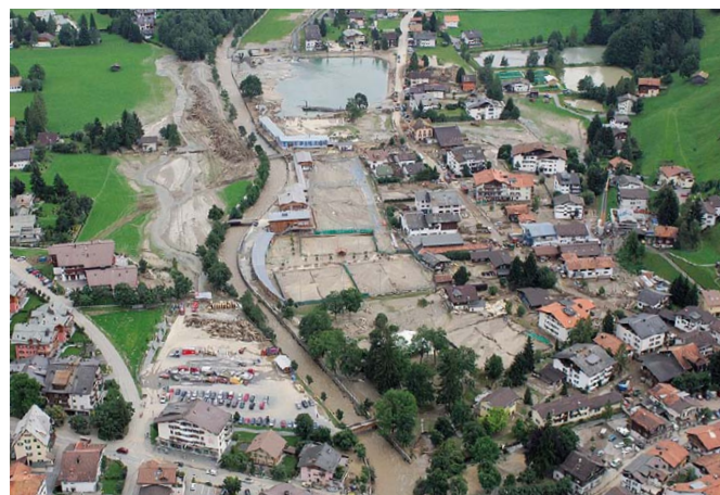
Fig. 2 Crue près de Klosters (GR) en août 2005.