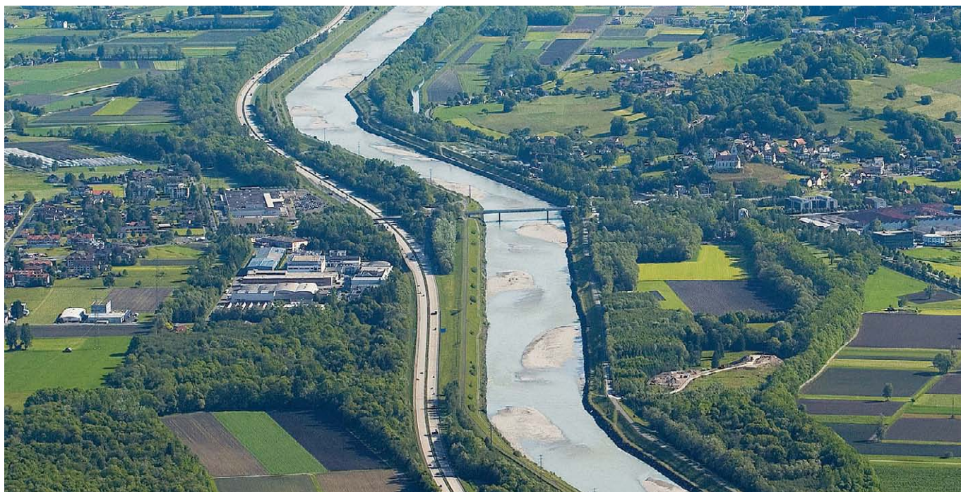
Vue aérienne de la vallée du Rhin alpin (Haag SG, Benden FL).

Environ 55 % des besoins énergétiques de la Suisse sont couverts par du courant produit dans les quelque 1600 centrales hydrauliques du pays (OFEN 2010). En prélevant de l'eau sur de longs tronçons, les centrales à accumulation modifient considérablement le régime des eaux des rivières. Les débits résiduels qui en découlent sont souvent bien inférieurs au niveau naturel, ce qui se répercute sur la valeur paysagère et sur les fonctions écologiques de l'ensemble du bassin versant. L'eau retenue par les centrales à accumulation est turbinée au moment où les besoins en énergie sont le plus élevés. Elle est ensuite rejetée dans la rivière, provoquant des pics de débit artificiels. Ce régime d'éclusées, qui n'est pas naturel, a des