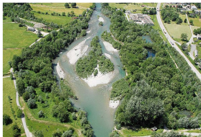
Fig. 3 Elargissement dans le val Mesolcina près de Grono (GR).