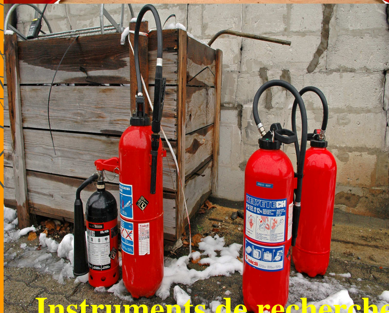
Instrument de recherche

Rares sont les inventaires pièce à pièce.