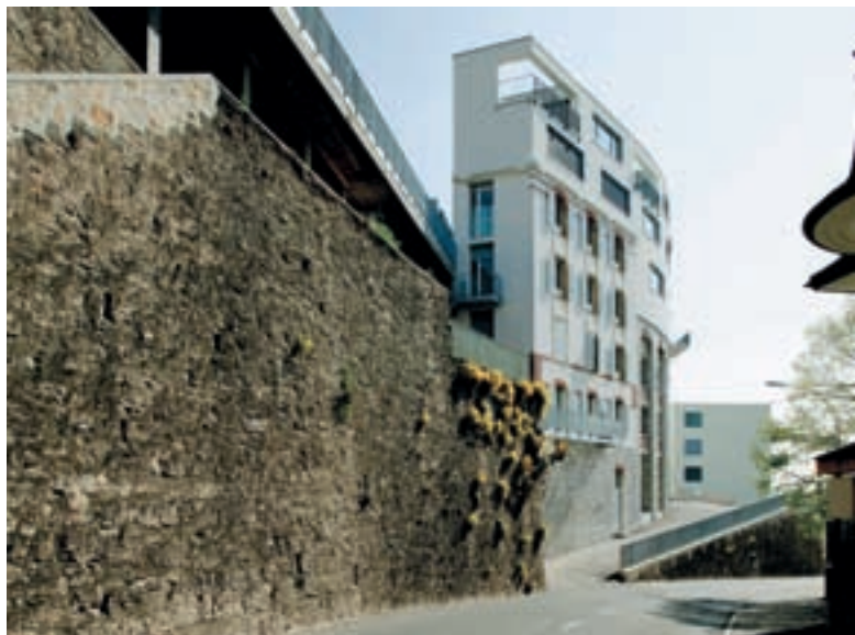
Quartier Ecoparc à Neuchâtel : la transformation d'un ancien immeuble artisanal a permis de créer une dizaine de lofts qui bénéficient du dégagement généré par la continuité morphologique de l'édifice avec les murs de soutènement du plateau ferroviaire. © Bauart Architectes et Urbanistes SA.