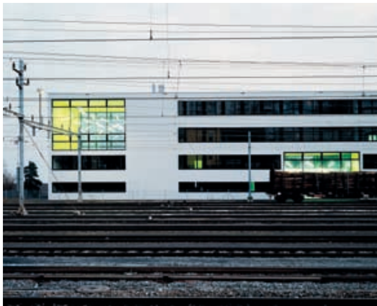
Le bâtiment CMN-HEG vu depuis le nord. © Bauart Architectes et Urbanistes SA.