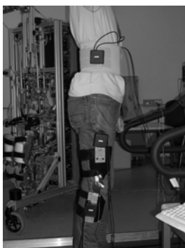
Figure 1 : Définition des angles et Montage avec les 3 modules

Le choix des capteurs était imposé, un système fait d'accéléromètre et/ou de gyroscope devait être conçu.